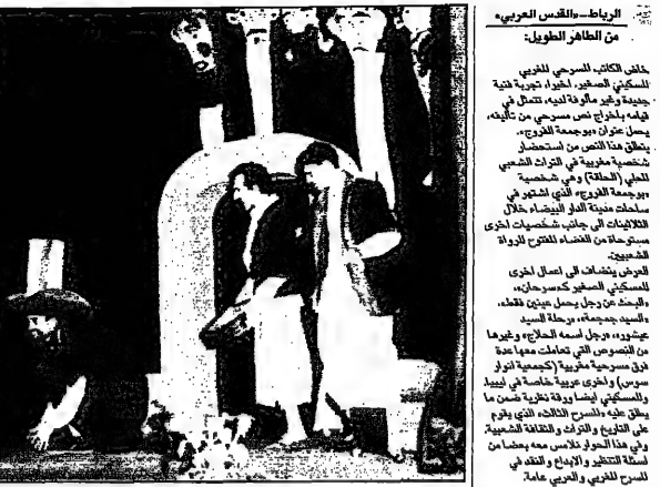
شخصية مسرحية مذكورة في قصة الفيلسوف المسافر (في الأسفل)